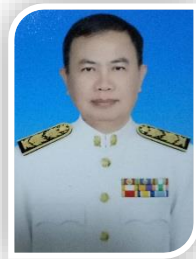
รองผอ. ฝ่ายพัฒนากิจการนักเรียน นักศึกษา